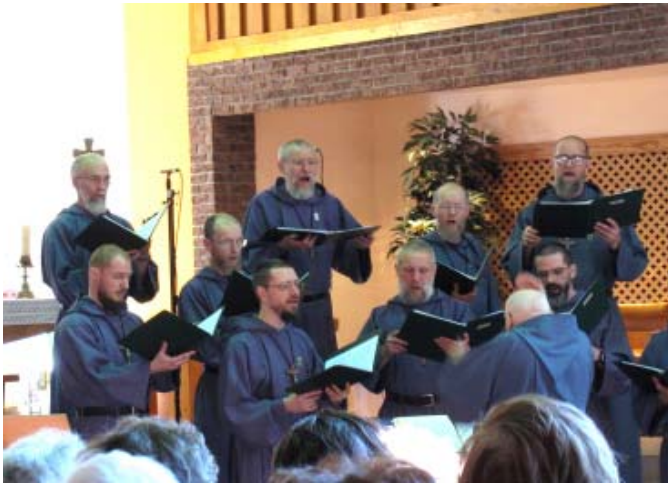
Les petits frères de saint François de Trois-Rivières en concert chez nous le 22 mars dernier.