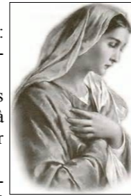
Saint Jean-Paul II

Notre-Dame de la fidélité, toi qui, sans cesse, recherchais le visage du Seigneur, toi qui as accepté le mystère et qui l'a médité dans ton cœur, toi qui as vécu en accord avec ce que tu croyais, toi qui fus l'exemple même de la constance dans l'épreuve comme dans l'exaltation, aide-nous à tenir nos engagements, dans une fidélité toujours grandissante jusqu'au dernier jour de notre vie sur la terre. Amen.